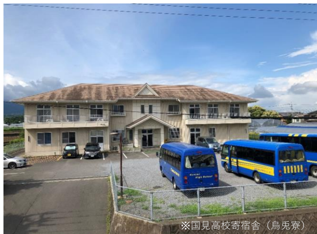
※国見高校寄宿舍（鳥免寮）