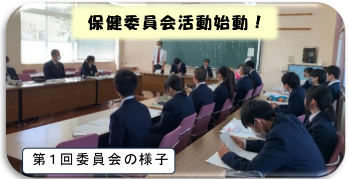
保健委員会活動始動！

私たち保健委員会では皆さんが健康に学校生活を送れるように今年度も次の目標を掲げ、活動を行います。