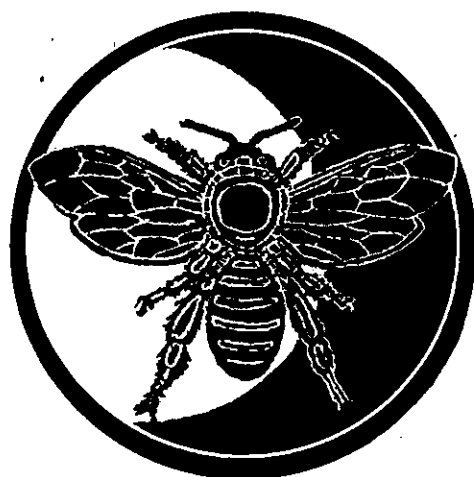
【五高定のシンボルマーク】