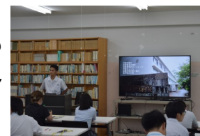
離島留学生による体験発表

また、希望者には民泊体験、奈留島巡検、しま親宅訪問も実施し、奈留島での暮らしや景色の美しさも存分に伝えることができました。ご協力いただきました皆様、本当にありがとうございました。