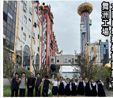
大阪広域環境施設組合 舞洲工場

三年生は10月8日(火)～11日(金)にかけて、関西方面への修学旅行を実施しました。台風も含めて、天候に気をもみましたが、全く支障なく実施できました。