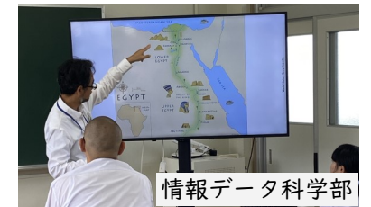
情報データ科学部