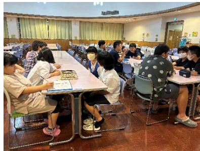
執行部会。議題は花火大会の 振り返りでした。