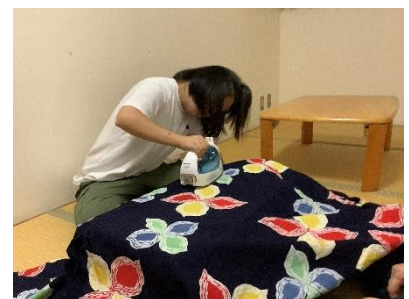
花火大会で着た浴衣のアイロン がけをしています。