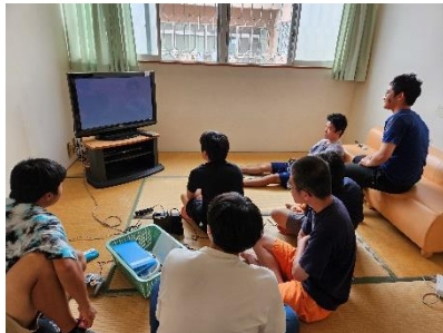
この日は体育祭の代休日。 みんなでゲーム中です。