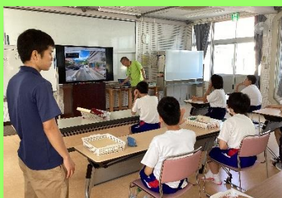
<地域の施設を利用しよう>