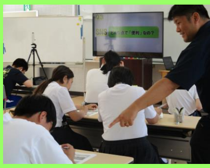
<SNSや携帯電話の使用>