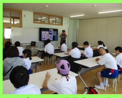
<タブレットや携帯電話の使用>