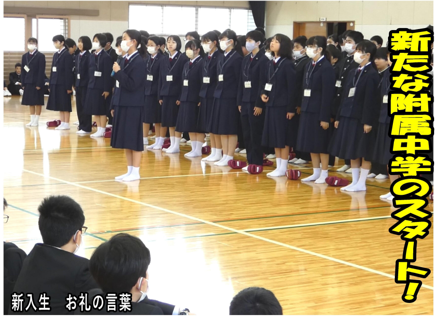
新入生 お礼の言葉