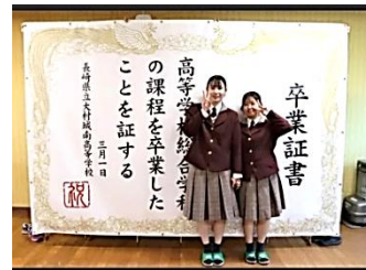
長崎新聞(2/29)に掲載された写真

また、今年は新たな試みとして、3学年の先生方が生徒の思い出に残るものを用意しようと、全国の事例を参考にしながら「巨大な卒業証書に見立てた記念撮影用の幕」を卒業記念品として購入しました。このことは2月29日の長崎新聞でも紹介されました。参列された保護者からも「いい取り組みですね。」という言葉いただきました。