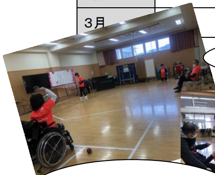
日頃の部活動の様子