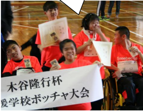
全国大会の様子 銀メダル獲ったぞ!