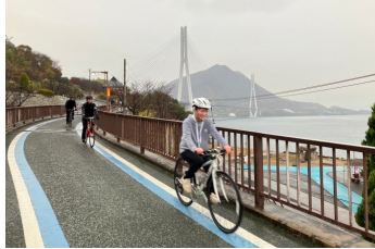
【しまなみ海道サイクリング】