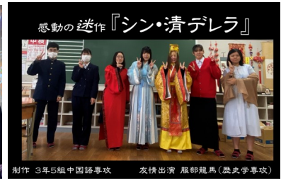
【3年中国語】 演劇動画を披露し、会場を笑いの渦に包みました。