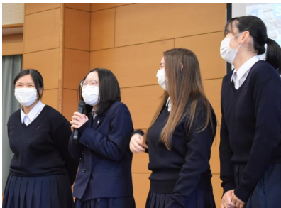
思い出や感謝の言葉を述べる3年生