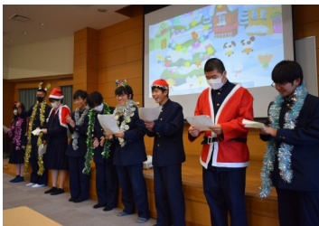
【1年中国語】 中国語による歌と会話で、会場を盛り上げました。