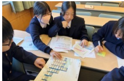
実際に予算案を立て、税金の大切さについて学ぶ生徒たち

財務省福岡財務支局の職員の皆様にご来校いただき、日本の財政や少子高齢化と社会保障について、講義をしていただきました。