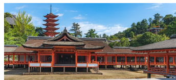
【厳島神社】 生徒満足度 ランキング 1