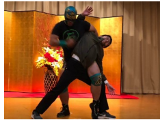
夕食時には愛媛プロレスのサプライズ興行あり！