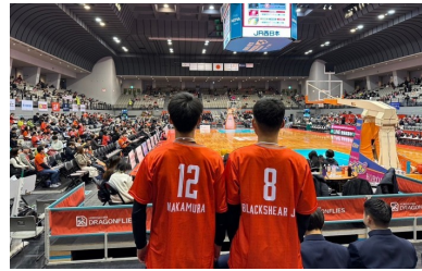
【プロバスケットBリーグ観戦】 広島ドラゴンフライズ VS 京都ハンナリーズ 生徒満足度 ランキング 2