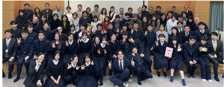
一年間ありがとうございました!