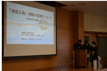
【3年歴史学】 『「神宿る島」老岐の信仰について』 ～歴史の変遷と特異性～ (奈良大フォーラム佳作受賞)

12月10日(日)、保護者等様、里親様をお招きして、今年度の学習成果を発表しました。アカデミックな歴史学、明るく楽しい中国語、バラエティー豊かな発表会となりました。