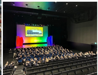
生徒満足度 ランキング 3