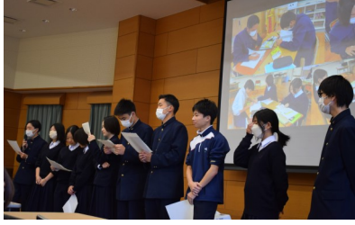
【2年中国語】 今年度の中国語専攻の様々な取組についてまとめました。