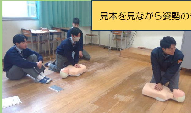
見本を見ながら姿勢のチェック