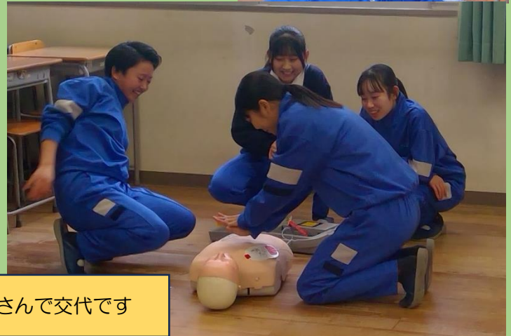
いちにのさんで交代です