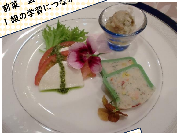
前菜 盛り付け方、彩り 1級の学習につながります