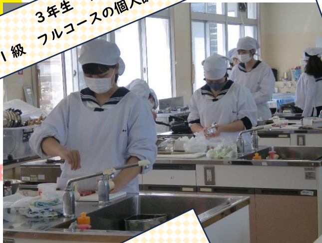
3年生 フードデザイン 1級 フルコースの個人調理 練習