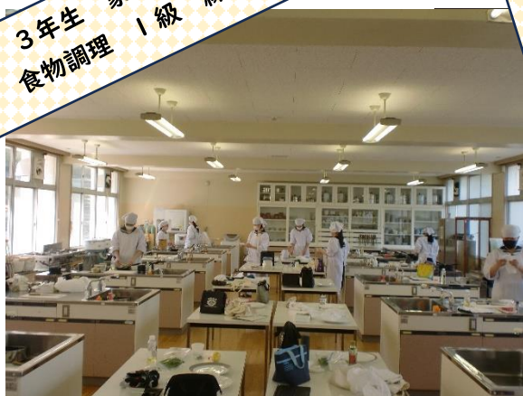
3年生 家庭科技術検定 食物調理 1級 練習中!