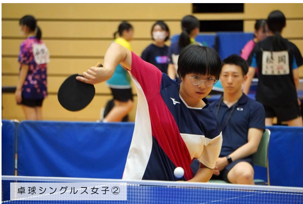
卓球シングルス女子②