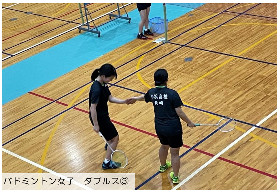
バドミントン女子 ダブルス③