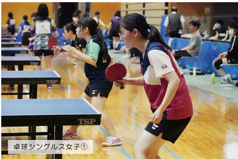
卓球シングルス女子①