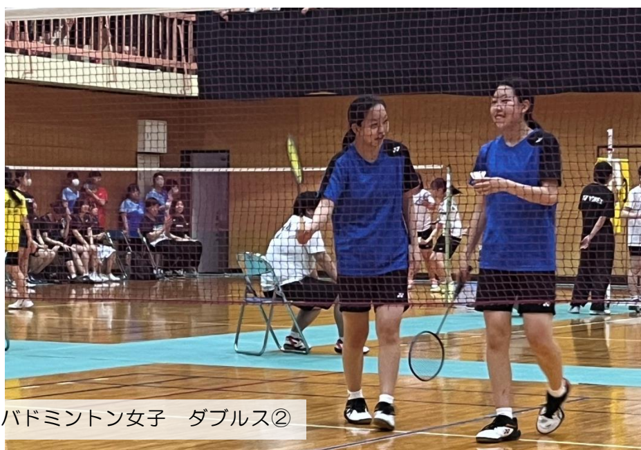
バドミントン女子 ダブルス②