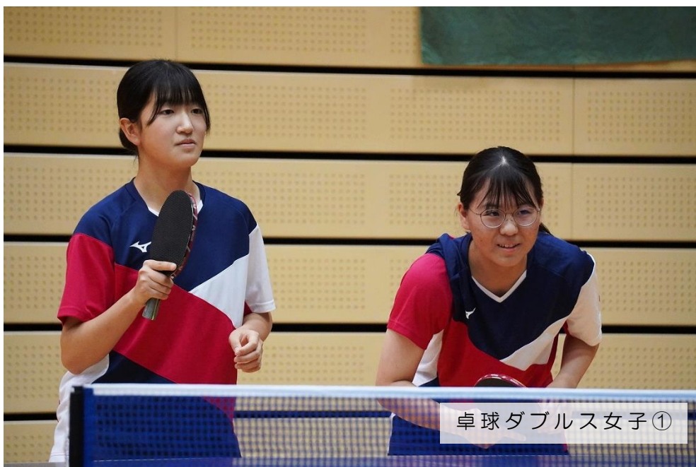
卓球ダブルス女子①