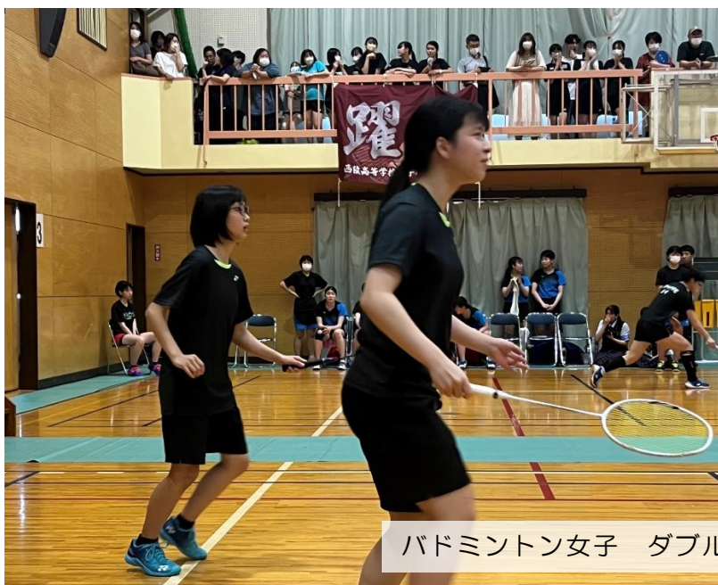
バドミントン女子 ダブルス①