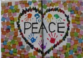
8月9日の平和学習で、全校生徒で制作したピースメッセージ