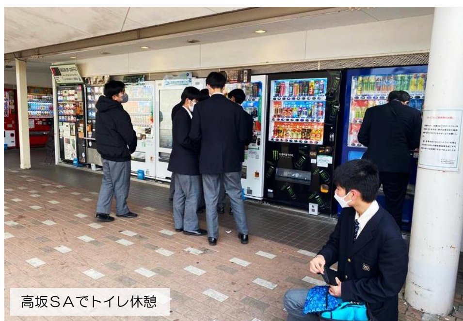
高坂SAでトイレ休憩