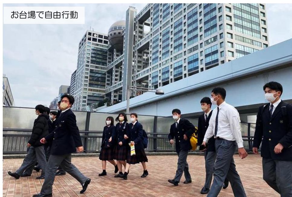
お台場で自由行動