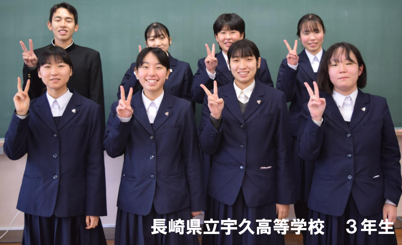
長崎県立宇久高等学校 3年生