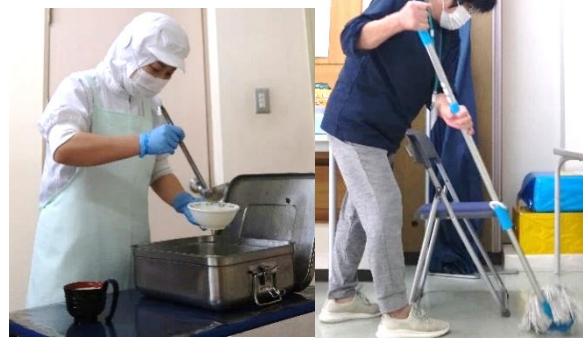
給食配膳をする調理職員