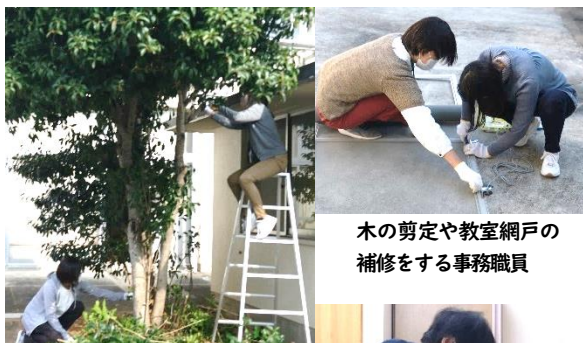
木の剪定や教室網戸の補修をする事務職員

勤労感謝の日は、国民の休日の一つで、「勤労を尊び、生産を祝い、国民が互いに感謝し合う」との趣旨で1948年に制定されました。校内でも、担任や教科担当者以外にも様々な職員が子どもたちの安心安全な学校生活のため、様々なことを行っています。日頃の感謝の気持ちを込めて、その一部を紹介します。