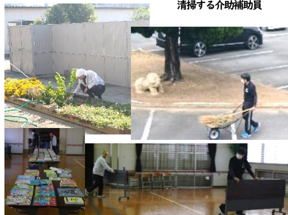
早朝から除草や教材作成、授業の事前準備をするベテラン教諭