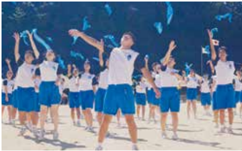
ことのうみ祭(体育の部)

歓迎遠足、球技大会、ことのうみ祭(文化の部・体育の部)、ロードレース大会、長崎明誠発表会等々。どれも一人ひとりの個性が生きる楽しい学校行事です。