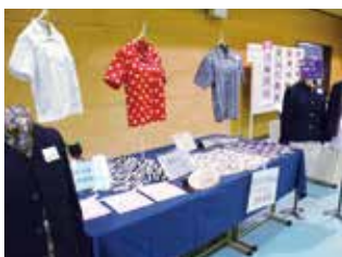
ファッション造形基礎

※必修科目・選択必修科目および総合選択科目から「科目選択のルール」に基づいて受講科目を選び、自分の時間割を作成します。 ※希望者多数で授業の定員を超える場合、抽選で受講者を決定する場合があります。