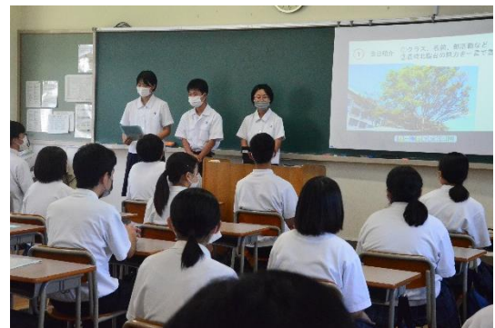
先輩との交流のようす