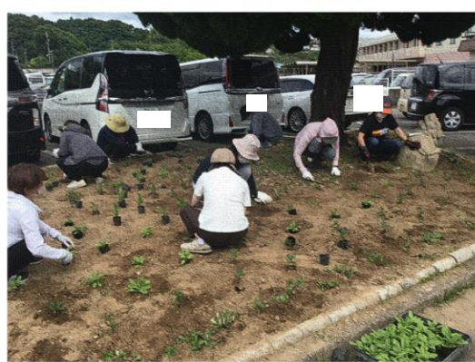
暑い中、力を合わせた作業の様子「お疲れ様です」