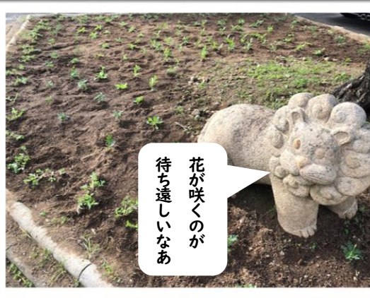
花苗を見守る らいおんくん