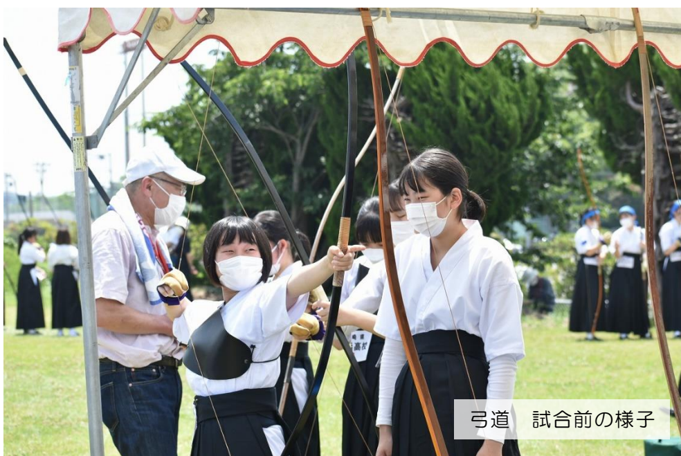
弓道 試合前の様子