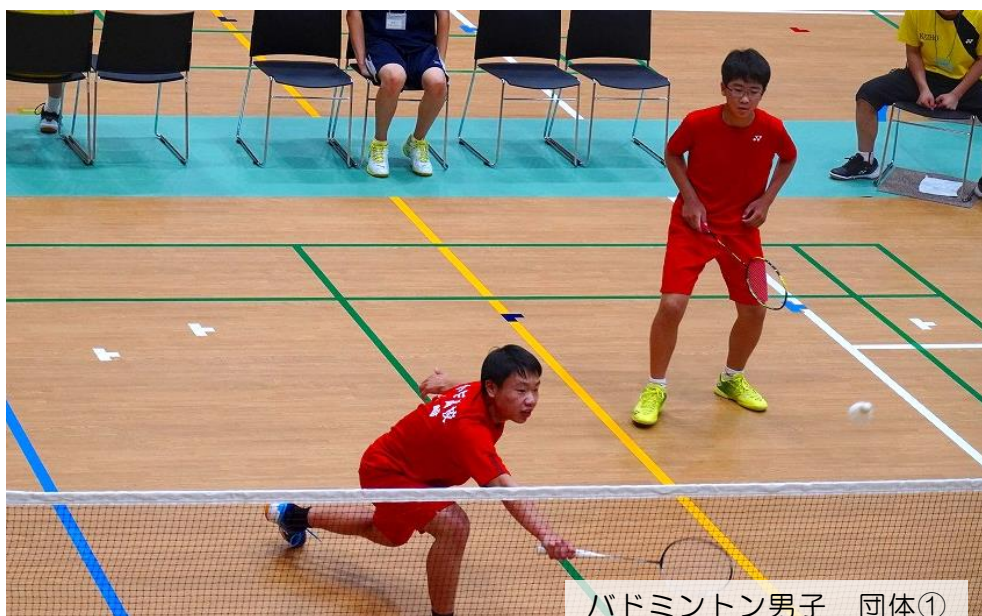
バドミントン男子 団体①