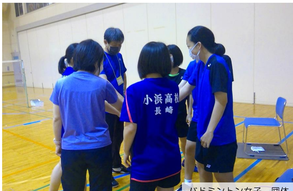
バドミントン女子 団体