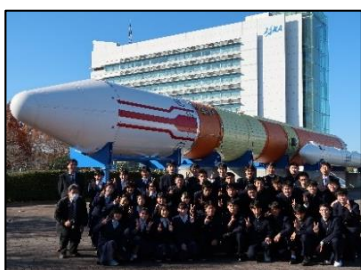
〔宿泊研修（フィールドワーク・探究活動）〕