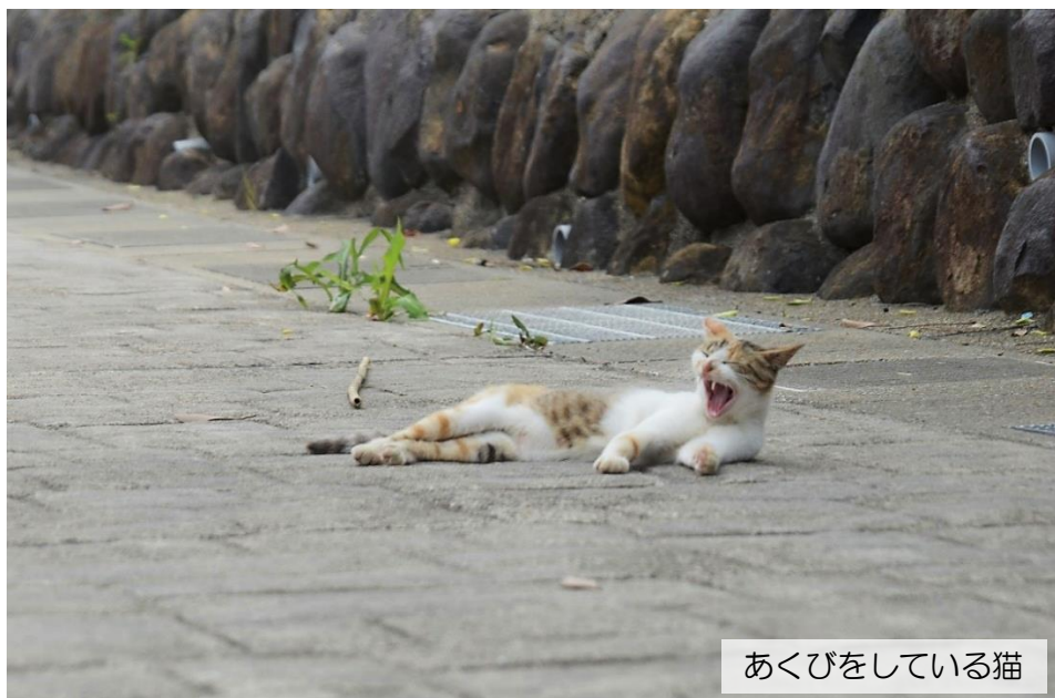
あくびをしている猫