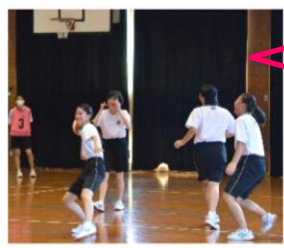
《女子ドッチボール》 優勝：1-1A 2位：3-2

7月19日(月)本校生徒、鶴南特別支援学校西彼杵分教室の生徒で校内球技大会を実施いたしました。男子はキックベースボールとバレーボール、女子はドッチボールを行い、クラスの団結や他学年・分教室との交流を深めました。体育委員を中心とした企画・運営と、体育委員・バレーボール経験者による公平な審判で、生徒全員が全力で楽しめる大会となりました。