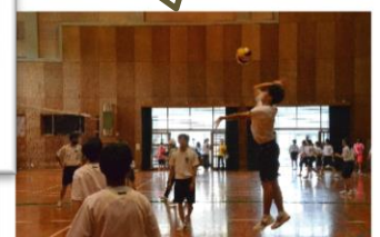
《男子バレーボール》 優勝：3-2A 2位：3-1