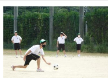
《男子キックベースボール》 優勝：2年 2位：鶴南