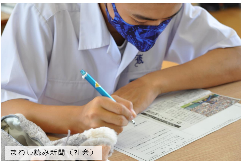
まわし読み新聞（社会）