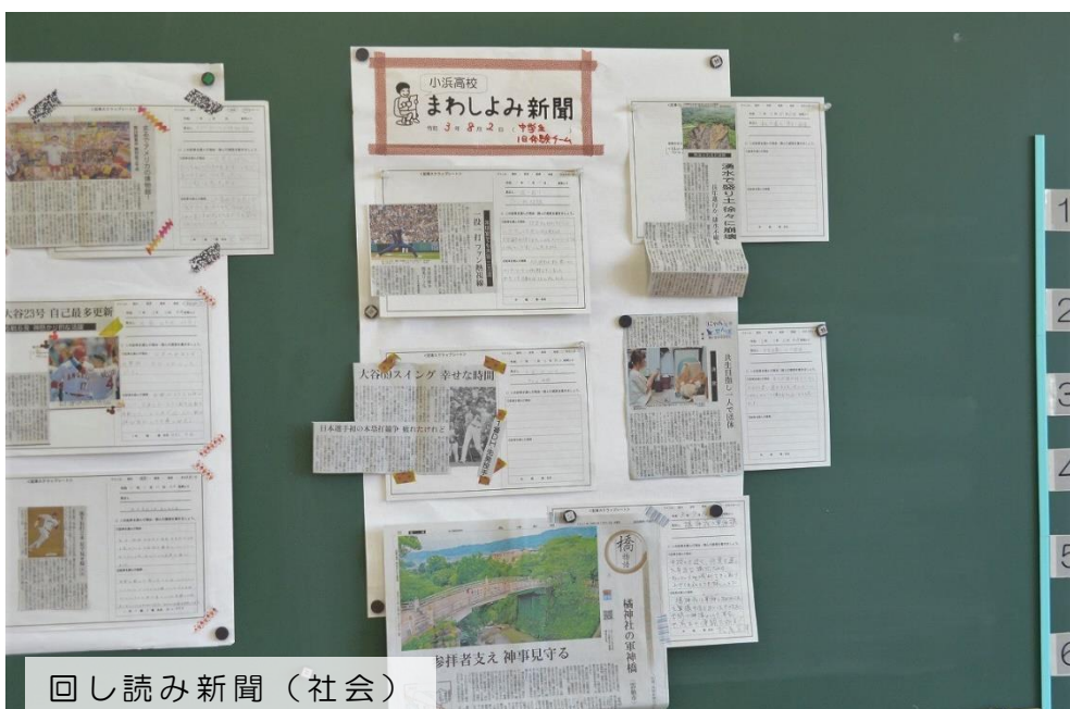
回し読み新聞（社会）