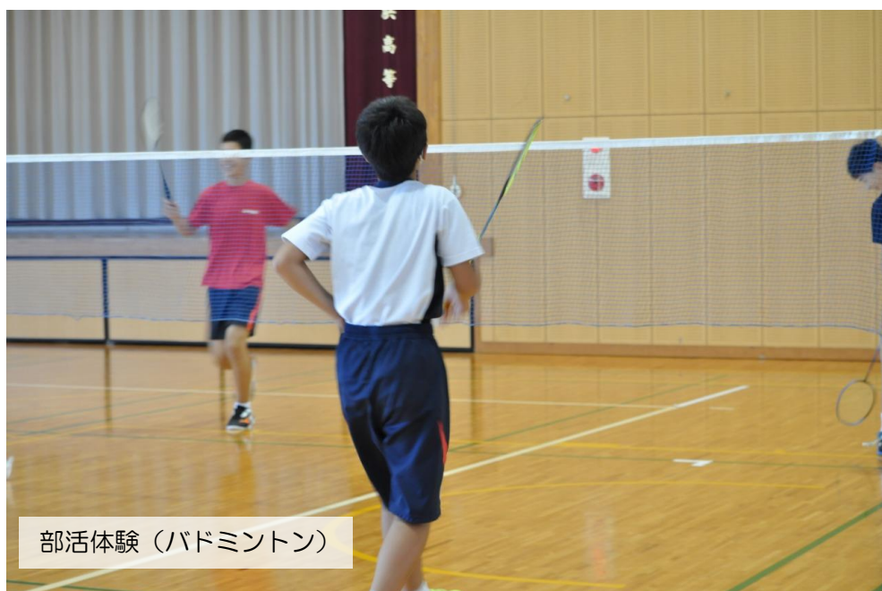
部活体験（バドミントン）