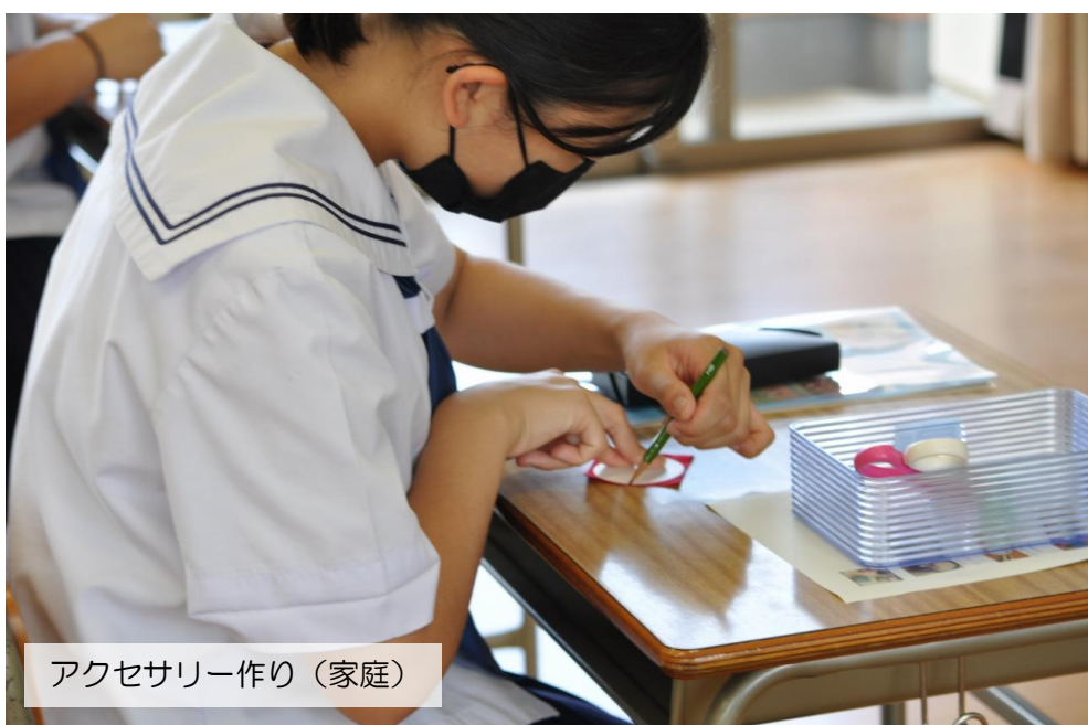
アクセサリ作り（家庭）