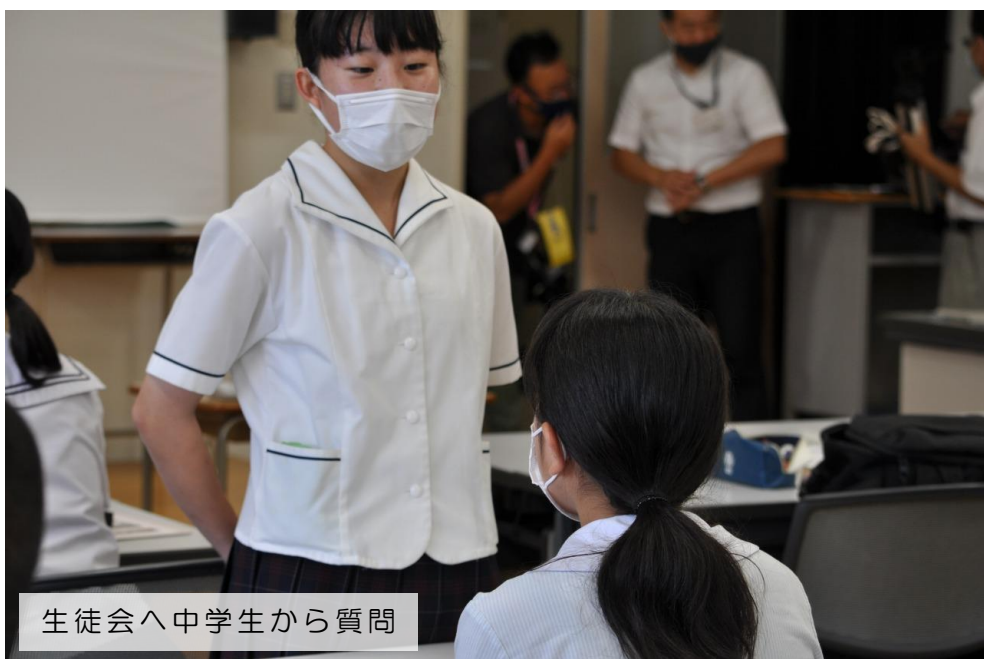
生徒会へ中学生から質問