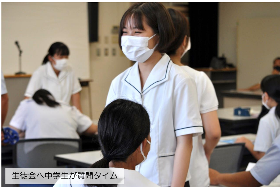
生徒会へ中学生が質問タイム