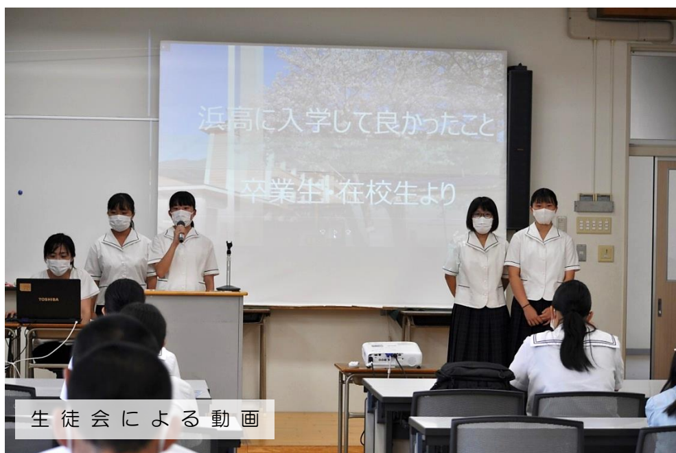
生徒会による動画