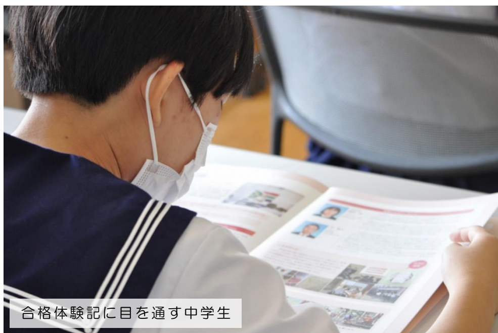
合格体験記に目を通す中学生