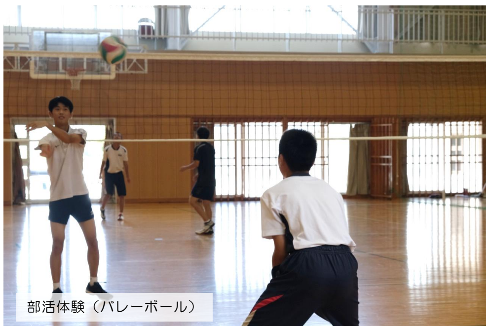
部活体験（バレーボール）