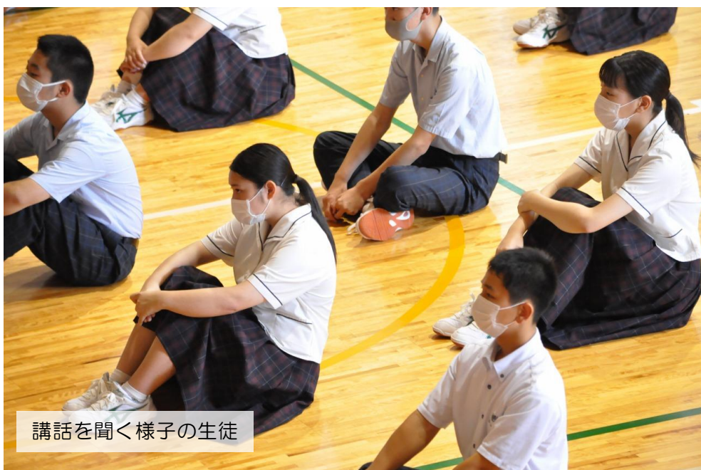
講話を聞く様子の生徒