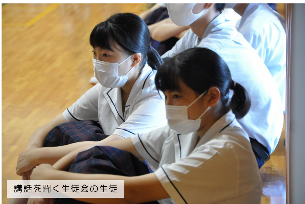
講話を聞く生徒会の生徒