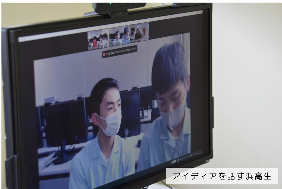
アイデアを話す浜高生