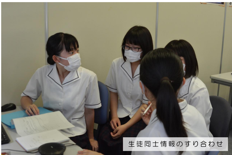
生徒同士情報のすり合わせ