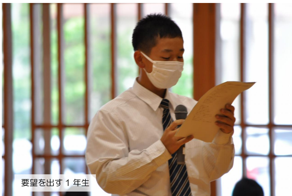
要望を出す 1 年生