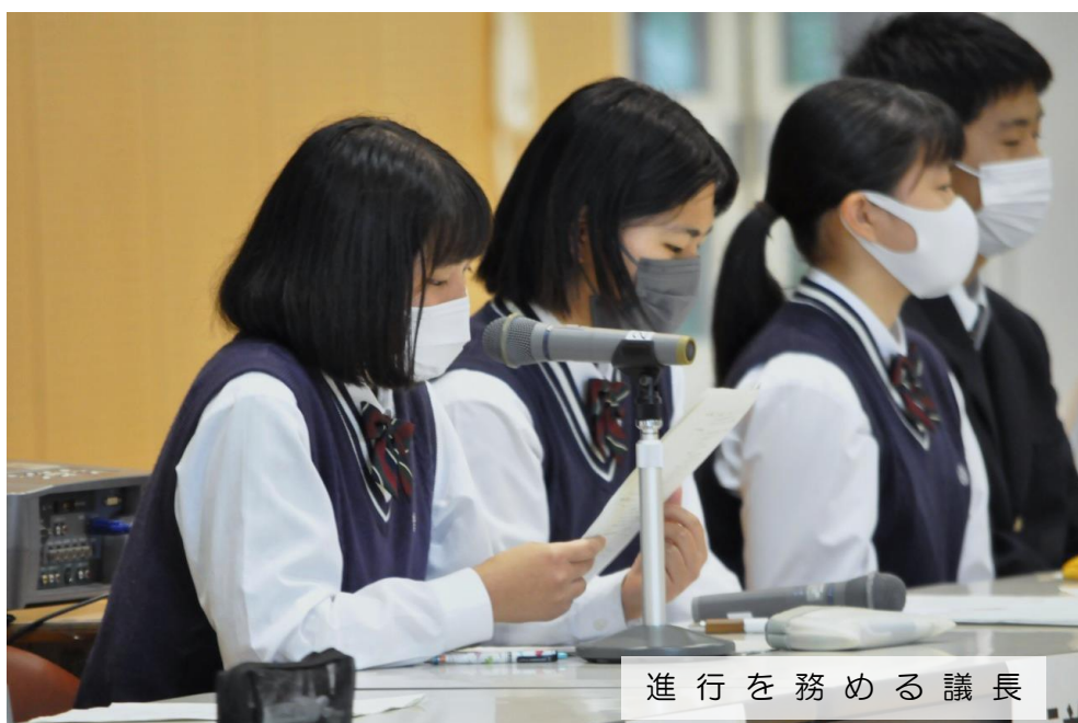
進行を務める議長