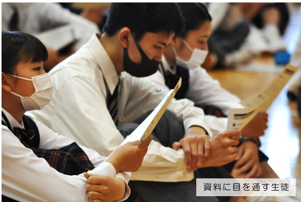
資料に目を通す生徒