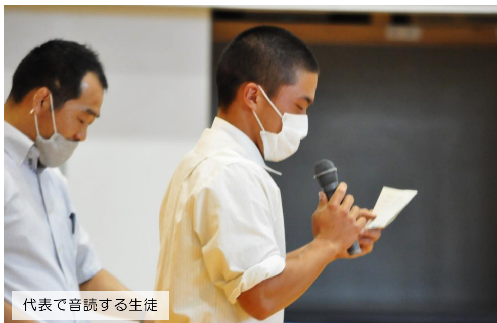
代表で音読する生徒