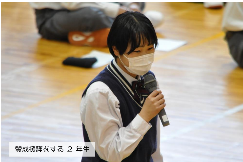
賛成援護をする 2 年生