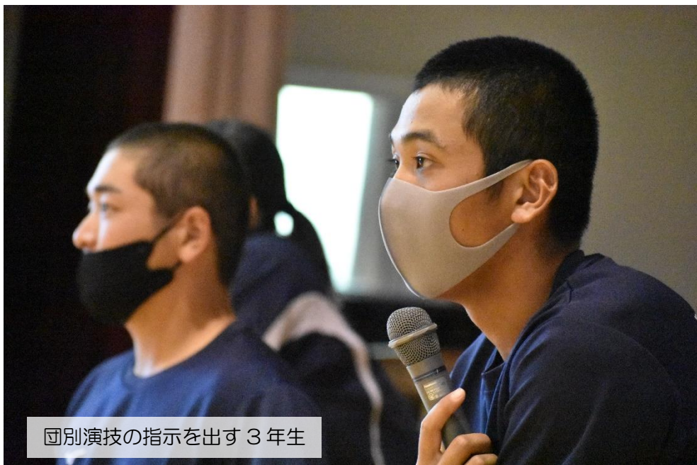
団別演技の指示を出す 3 年生