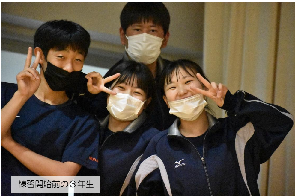
練習開始前の3年生