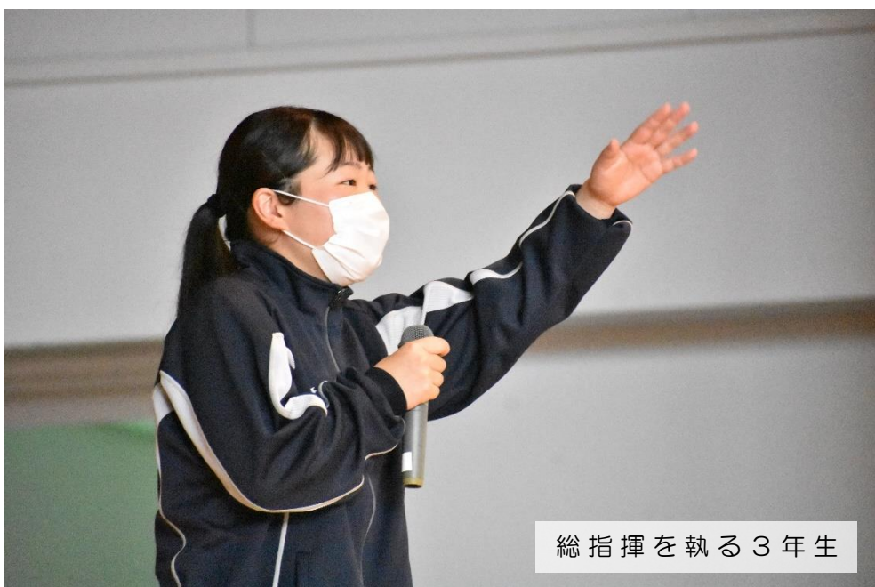
総指揮を執る3年生