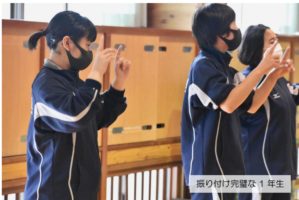
振り付け完璧な1年生