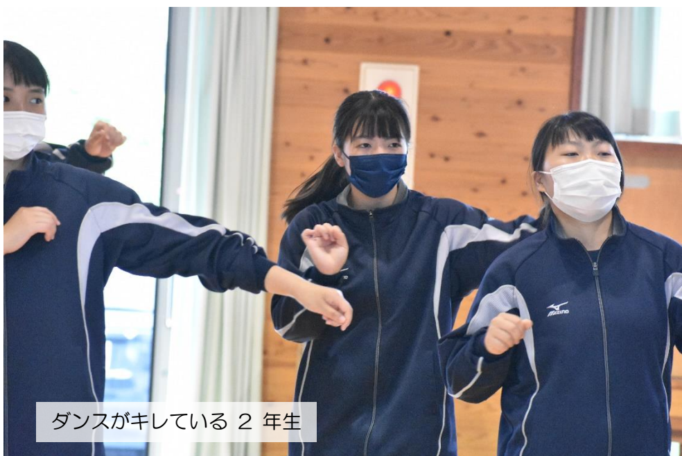
ダンスがキレている2年生