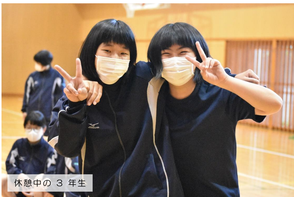
休憩中の 3 年生