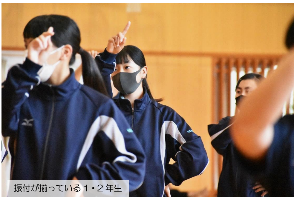
振付が揃っていない1・2年生