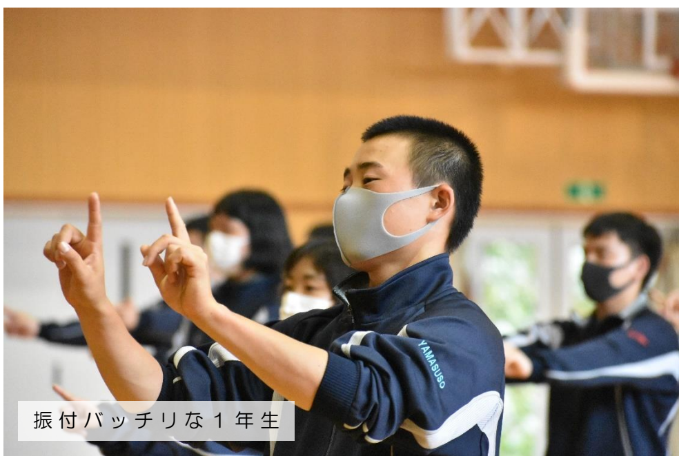
振付バッチリな1年生