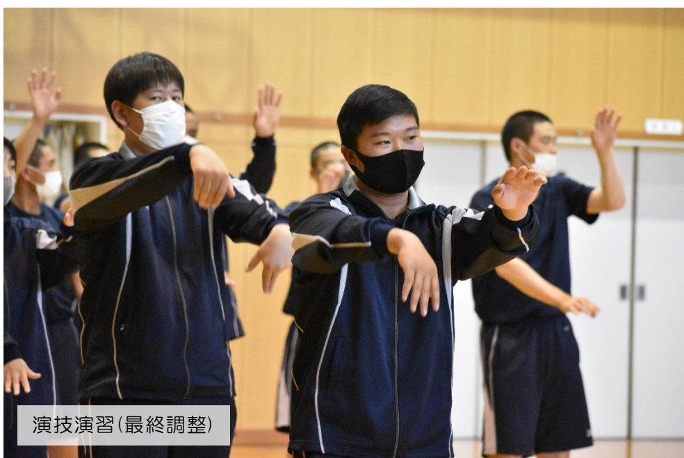
演技演習(最終調整)