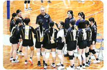
バレーボール部(女子)