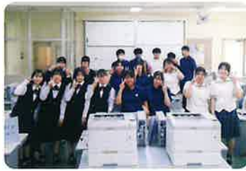
ビジネスライセンス部