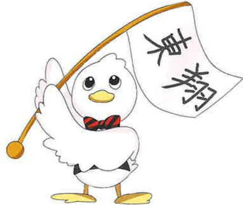
東翔高校マスコット：翔ちゃん