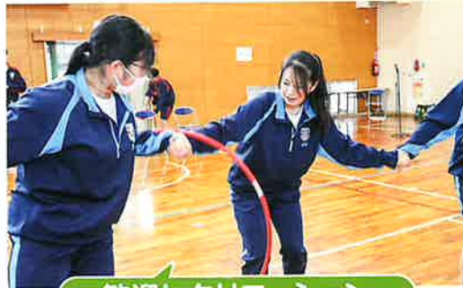
歓迎レクリエーション