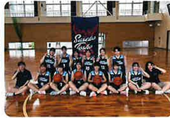
バスケットボール部(女子)