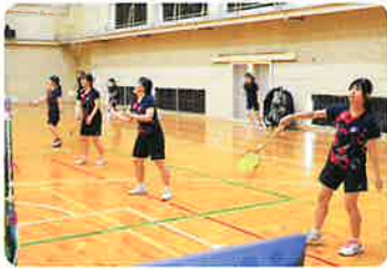
バドミントン部(女子)