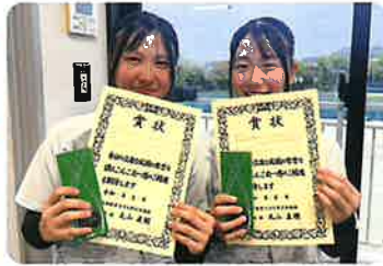
ソフトテニス部(女子)