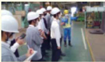
キャンパス・企業見学