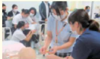
インターンシップ