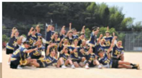
このうみ祭(体育の部)