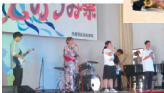
このうみ祭(文化の部)

歓迎遠足、球技大会、このうみ祭（文化の部・体育の部）、ロードレース大会、長崎明誠発表会等々。どれも一人ひとりの個性が生きる楽しい学校行事です。