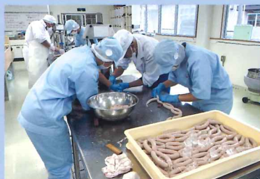
ソーセージの製造