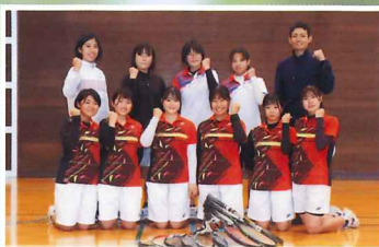
女子ソフトテニス部