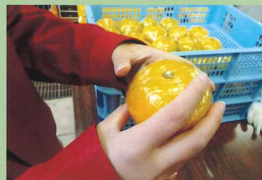
ミカンの長期保存