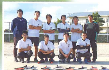
男子ソフトテニス部