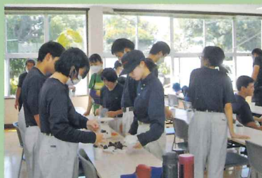
北松分校との交流