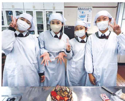
クリスマスケーキ