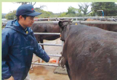
牛のブラッシング