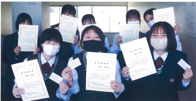
介護職員初任者研修修了