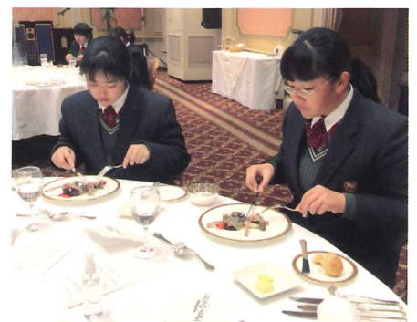
テーブルマナー講習