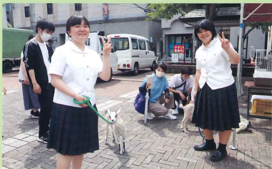
動物とのふれあい学習

和牛を中心とした大動物、また中小家畜（鶏）やペット動物の飼育管理の知識、技術について学びます。