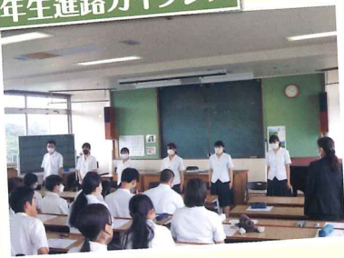
3年生進路ガイダンス