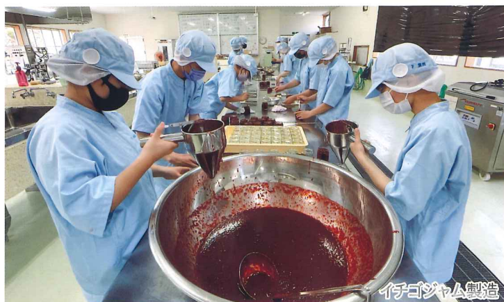
イチゴジャム製造