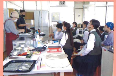
産業エキスパートセミナー