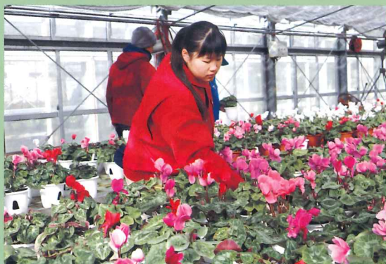
シクラメンの栽培