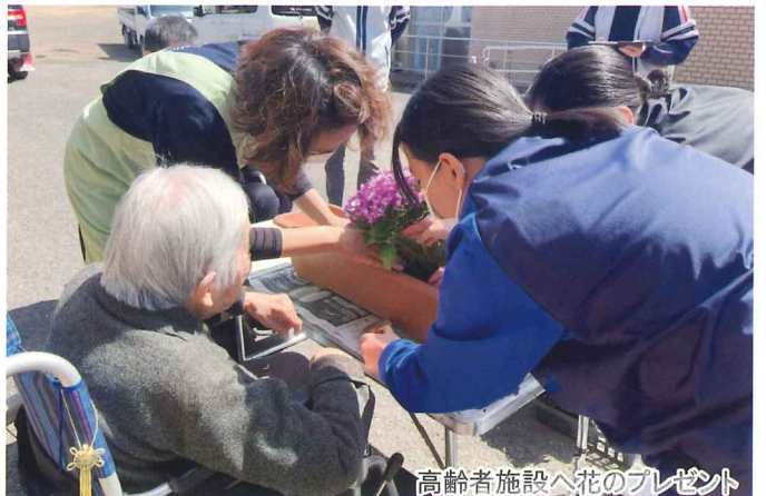
高齢者施設へ花のプレゼント