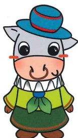
マスコットキャラクター「ホクノン」