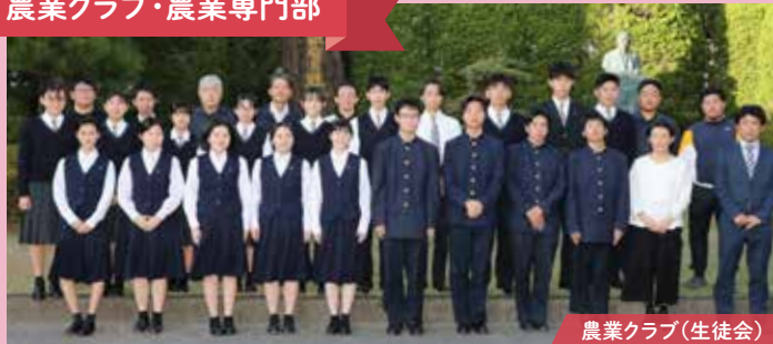
農業クラブ(生徒会)