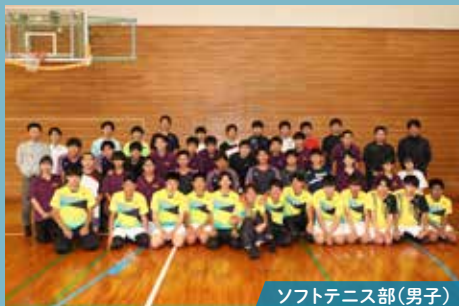
ソフトテニス部(男子)