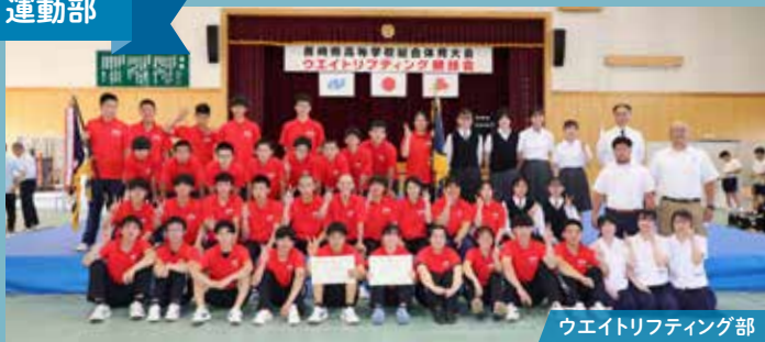
ウエイトリフティング部