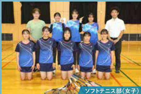
ソフトテニス部(女子)