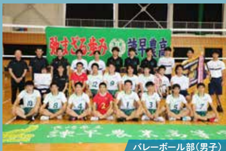
バレーボール部(男子)