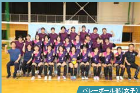
バレーボール部(女子)