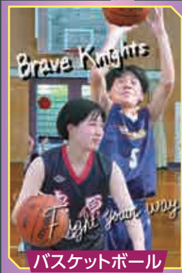
バスケットボール