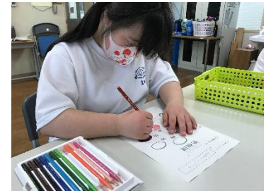
< 美術 >