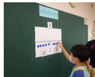
< 算数 >