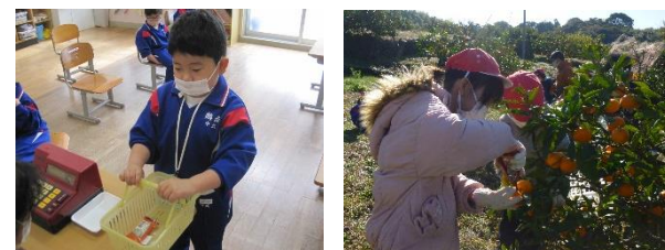
< 生活単元学習 >