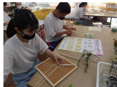
< 作業学習（手工芸班） >