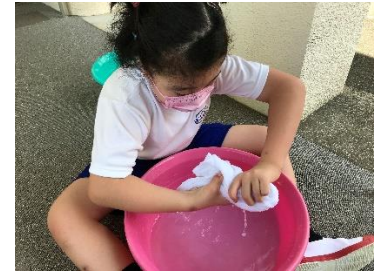
< 職業・家庭 >