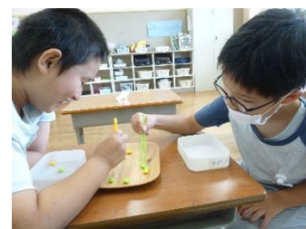
< 自立活動 >