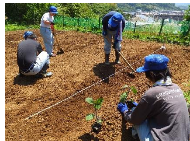
< 作業学習（農園芸班） >