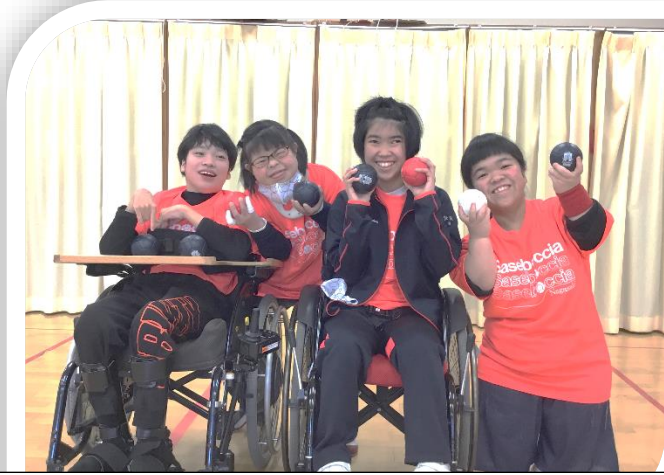
大会出場を目指す「SaseboBurgers ~絆~」のメンバー

毎年実施されている全国ポッチャ選抜甲子園は、今年度は新型コロナウイルス対策のため、オンライン開催となっている。本校では、来月実施されるこの大会への出場を目標にしているが、8日(月)に、まずは予選である「出場校に与えられた課題」にチャレンジ。その様子を動画撮影し、本部に発信した。目指せ、予選突破！