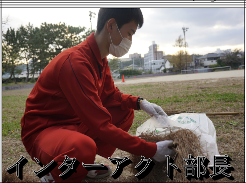
インターアクト部長