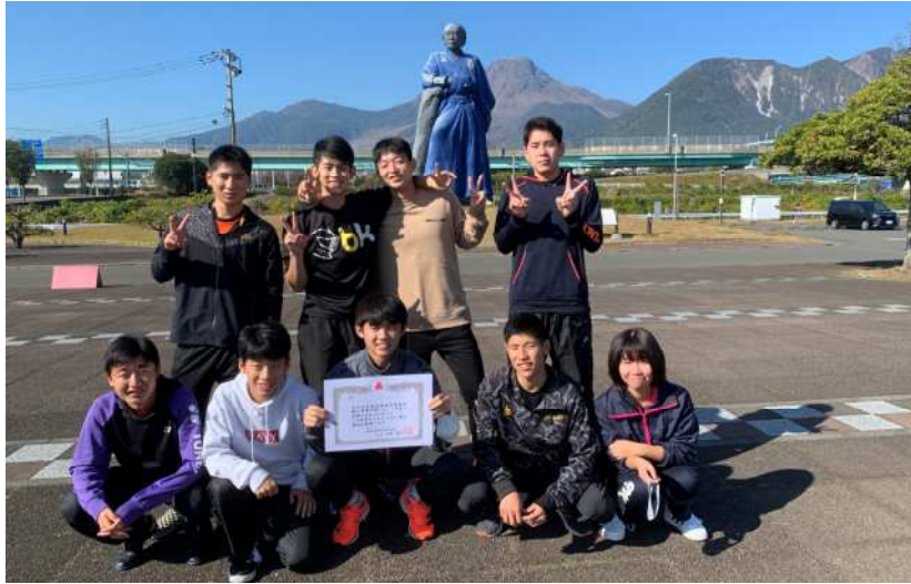
男子バドミントン部