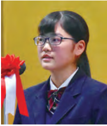
生徒会長 ATさん 3年 野球部 小浜中出身

小浜高校は、生徒数が少ないからこそ様々なことに挑戦でき、自分を成長させることができます。普通科の生徒でも商業の資格を取得することができます。担当の先生が丁寧に教えてくださいます。学校行事では、一人一人が主役として輝くことができ、皆と一緒に盛り上げて楽しむことができます。進路面では、先生方の手厚いサポートがあるため、目標に向かって自信をもって取り組むことができます。先輩方も進路実現を達成された方ばかりです。