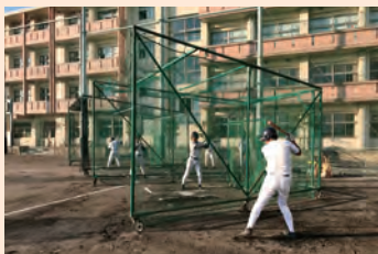
3カ所でのフリー打撃