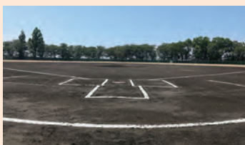
内野は良質の黒土