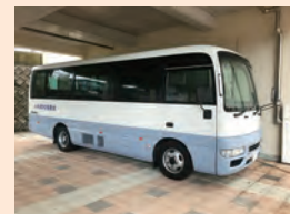
移動用同窓会バス