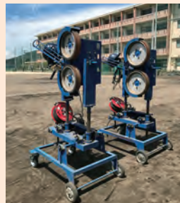
ピッチングマシン