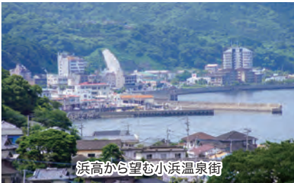
浜高から望む小浜温泉街