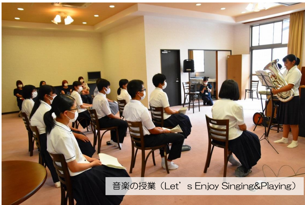
音楽の授業 (Let' s Enjoy Singing&Playing)