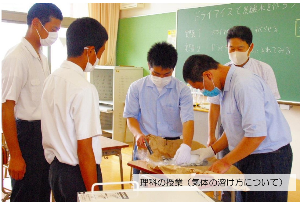
理科の授業 (気体の溶け方について)