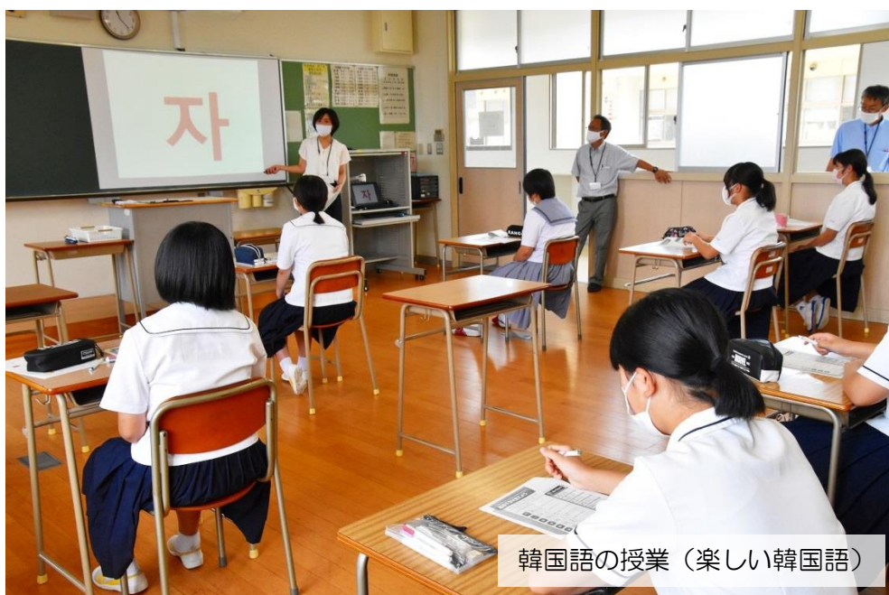
韓国語の授業（楽しい韓国語）

模擬授業の後は、アンケートに回答してもらいました。 その後、希望者は、部活動見学（体験）に参加しました。