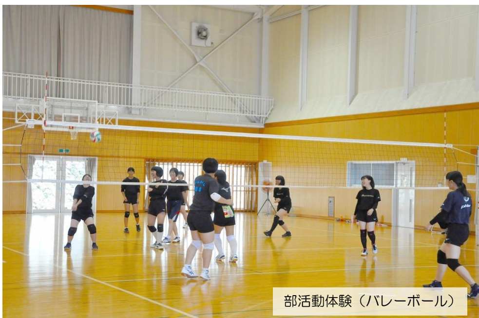
部活動体験（バレーボール）