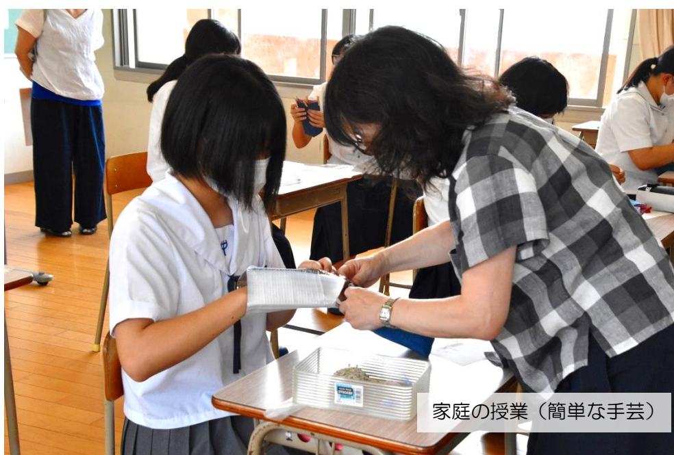
家庭の授業（簡単な手芸）