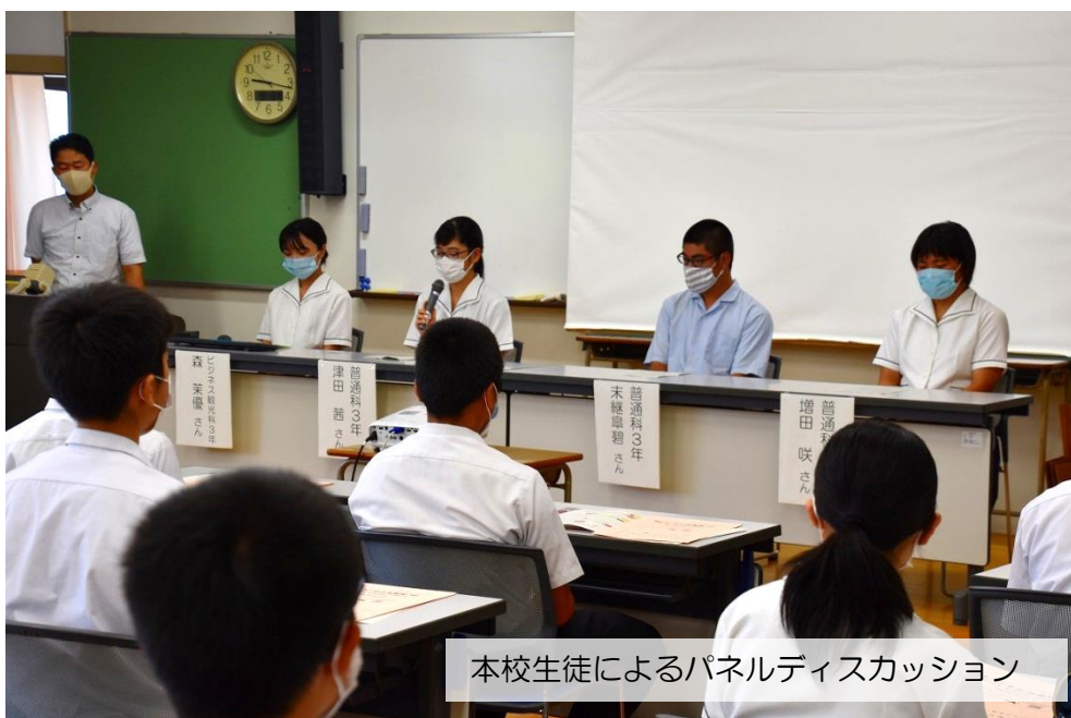
本校生徒によるパネルディスカッション