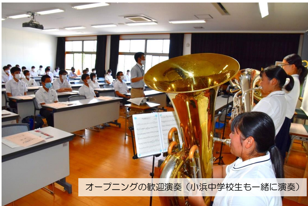
オープニングの歓迎演奏（小浜中学校生も一緒に演奏）

今年度初めての一日体験入学（オープンスクール）が実施されました。 中学生54名、保護者・引率者16名、合計70名と大盛況でした。 8/3（月）9：00～9：50 学校概要説明