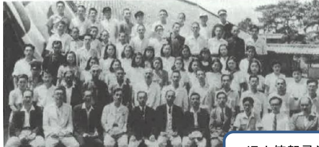
昭和24年7月 猶興館高校分校開校式の様子

島民の熱い高校設置の機運のおかげで、ついに昭和24年7月8日長崎県立平戸(現猶興館)高等学校小値賀分校設置が認可されました。当時は定時制高校でした。