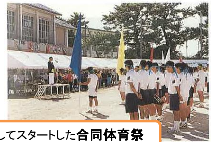
創立50周年記念としてスタートした合同体育祭