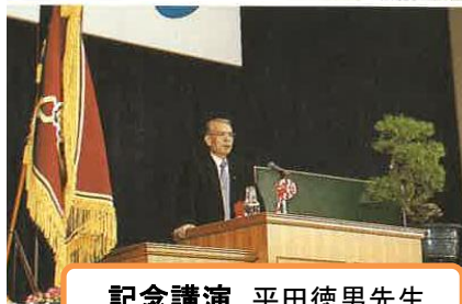
記念講演 平田徳男先生

創立50周年を迎えた平成12年度、5月体育館竣工、7月モニュメント除幕式、10月第1回中高合同体育祭等を経て、10月21日記念式典を迎えました。記念講演では、本校2回生で県教育次長も務められた平田徳男先生から「どうぞ、自信を積み重ねていってください！」と熱いメッセージがありました。