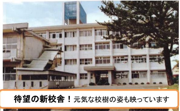
待望の新校舎！元気の校樹の姿も映っています

創立30周年に間に合うよう建設された最大の施設が、現在の校舎（管理教室棟、特別教室棟）です。それまでは、地元の方々が作っていただいた木造校舎が下足棟付近にあり、そこで授業を受けていました。