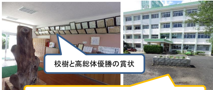
校樹と高総体優勝の賞状