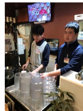
レストランまゆみ