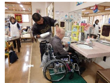
デイサービスだんらん