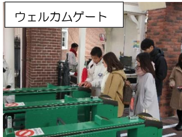
ウェルカムゲート

冬休み期間中ハウステンボスでのインターンシップに1・2年 19名の生徒が参加しました。事前に面接指導や事前研修を終えた生徒達は、12月25日(水)から1月5日(日)までハウステンボス内の各部署で実習を行いました。1月6日(月)のインターンシップ発表会では、その体験で学んだことをそれぞれ発表しました。 <インターンシップ発表会> <実習中>