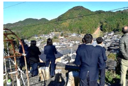
<波佐見町中尾地区>