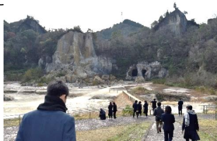
<有田町泉山磁石場>

12月7日(土)美術・工芸科1年生は、金富良舎の方に案内していただき、波佐見町、佐世保市三川内町、有田町を訪問し、実際の現場でそれぞれの文化や陶磁器の違い等について理解を深めました