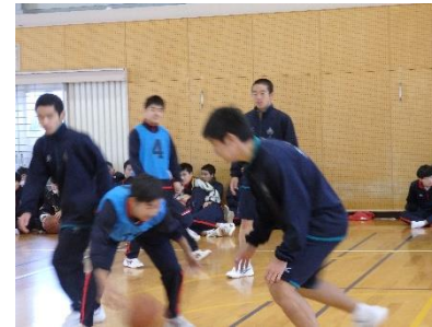
バスケットボール

12月23日(月)校内球技大会を開催しました。男子は、サッカー・バスケットボール・ソフトテニス、女子はバレーボール・ソフトテニスの競技でそれぞれ競い合いました。