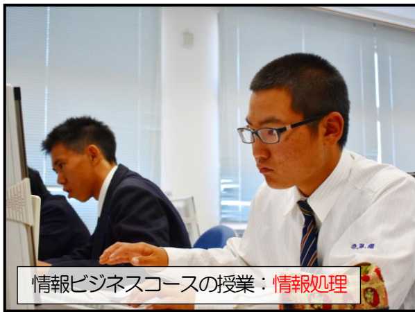
情報ビジネスコースの授業：情報処理