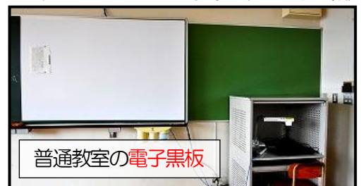
普通教室の電子黒板