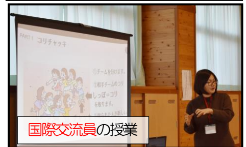
国際交流員の授業