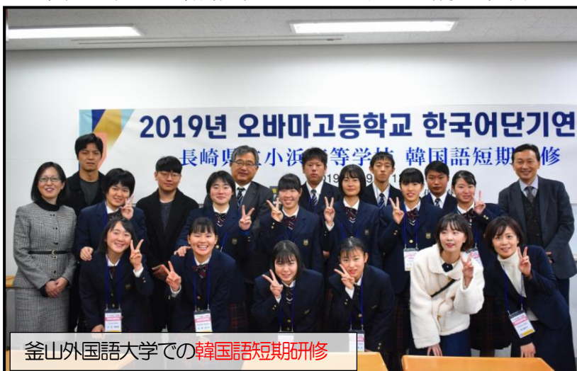
釜山外国語大学での韓国語短期研修