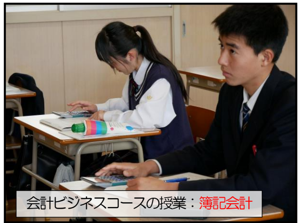
会計ビジネスコースの授業：簿記会計