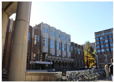
五高生を圧倒した 図書館