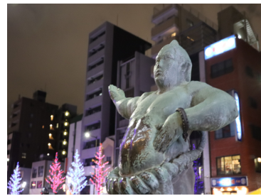
ホテル前の力士の像

にも入ることができ。階段を登っていく。この階段は、とてもかっこよく、憧れを持ってきた。私たちが行ったときに、わっとながかりで、新しいものがあふれている。そのまわりの環境や、整えられた日本文化の雰囲気が、地元の文化と比べて、驚かされた。レディの広さや、目の前に写る赤い門の前で、写真を撮る。大学の見学を最後に、東京大学を訪れてみて、