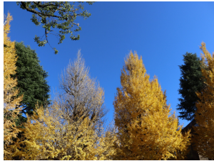
キャンパス中を彩る銀杏並木

にも入ることができ。階段を登っていく。この階段は、とてもかっこよく、憧れを持ってきた。私たちが行ったときに、わっとながかりで、新しいものがあふれている。そのまわりの環境や、整えられた日本文化の雰囲気が、地元の文化と比べて、驚かされた。レディの広さや、目の前に写る赤い門の前で、写真を撮る。大学の見学を最後に、東京大学を訪れてみて、