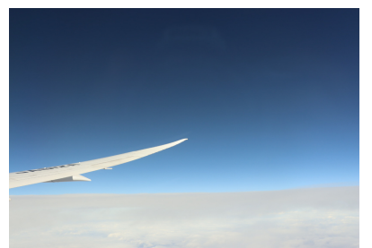
飛行機からの景色