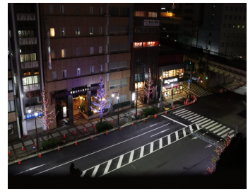
両国ビューホテルからの景色