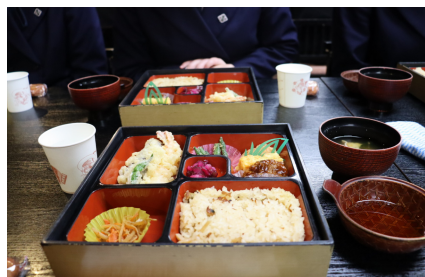
浅草 5656会館での食事