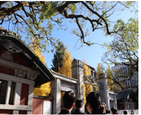
趣のある駒場キャンパス