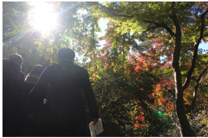
キャンパス内の紅葉

講話の後は各班のポスターセッション、代表が行われた。自分の発表の興味がある分野で、五島のために研究してきたことを発表する生徒一人一人の姿勢からはとても熱意が感