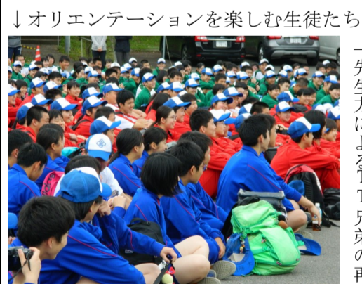
↓ オリエンテーションを楽しむ生徒たち

五島高校の春の恒例行事である「ふるさと散策」が、4月26日(金)に行われた。このふるさと散策は毎年コースが変わるため、それまで知らなかった五島の魅力に触れることができ。今年度は香珠子を折り返し地点とする全長約20キロメートルのコースを散策した。朝から曇り空が広がっており降雨が心配されていたが、ゴールまで天気が崩れることはなく、午後には太陽もぞいでいた。 私たち五高生と先生方は会話を弾ませながらいくつも山を越え2時間ほどかけて香珠子へと向かった。道中のチェックポイントには生徒会が準備したクイズがあり、五島市内や五高に関する問題が出されていた。即答というわけにもいかず、頭を悩ませている生徒が数多く見られた。香珠子に到着してから行われたレクリエーションでは、まず五島高校の伝統のひとつで