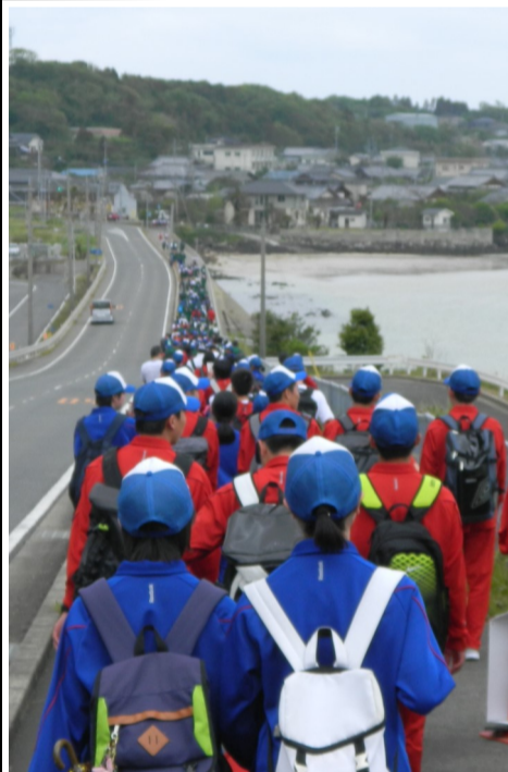
← 目的地の香珠子から五高に戻る様子