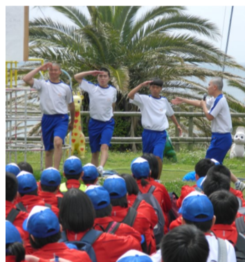
↑ ↓ G4のパフォーマンス

五島高校の春の恒例行事である「ふるさと散策」が、4月26日(金)に行われた。このふるさと散策は毎年コースが変わるため、それまで知らなかった五島の魅力に触れることができ。今年度は香珠子を折り返し地点とする全長約20キロメートルのコースを散策した。朝から曇り空が広がっており降雨が心配されていたが、ゴールまで天気が崩れることはなく、午後には太陽もぞいでいた。 私たち五高生と先生方は会話を弾ませながらいくつも山を越え2時間ほどかけて香珠子へと向かった。道中のチェックポイントには生徒会が準備したクイズがあり、五島市内や五高に関する問題が出されていた。即答というわけにもいかず、頭を悩ませている生徒が数多く見られた。香珠子に到着してから行われたレクリエーションでは、まず五島高校の伝統のひとつで