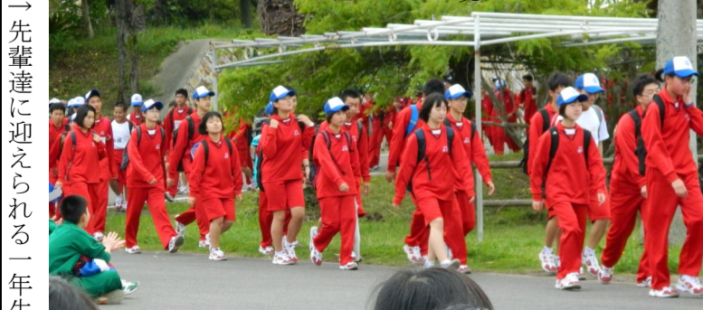
→ 先輩達に迎えられる一年生

進級・入学おめでとうございませう。激動の平成も終わり、いよいよ「令和」という新しい時代が始まりました。この令和という元号は万葉集に収録されている大伴旅人の「梅花の歌」から引用されていると言われていて、国民ひとりひとりが明日への希望を持ち、それぞれの花を大きく咲かせることができるような日本でありたいという願いが込められているそうです。 さて、我々新聞部は昨年度のコンクールで優秀賞をいただきましたので、7月に佐賀県で行われる全国高校総合文化祭に出場いたします。これに満足せず、今年度も新聞作りに励んでいきますので、楽しみにしていてください。今年度もどうぞよろしくお願ひします。(柳)