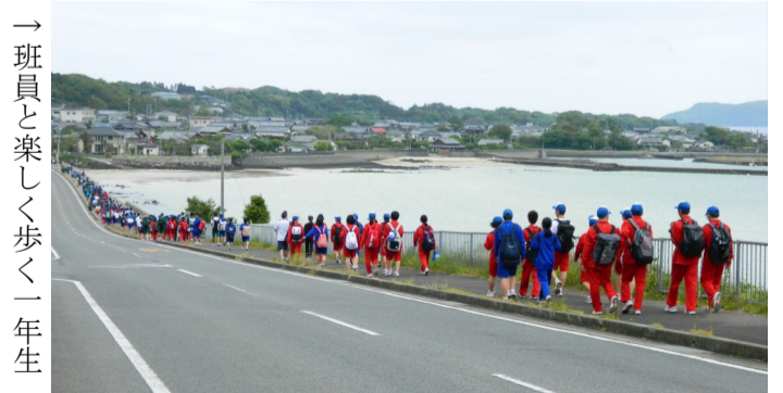
→ 班員と楽しく歩く一年生