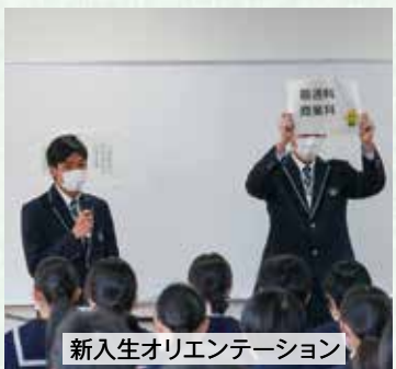
新入生オリエンテーション

さらに文化部芸術祭では、外部団体への出演交渉などからイベントをつくります。責任の大きい仕事ですが、終わった後の達成感や充実感は他では味わえません！