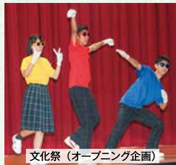
文化祭（オープニング企画）