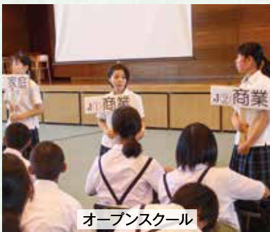
オープンスクール