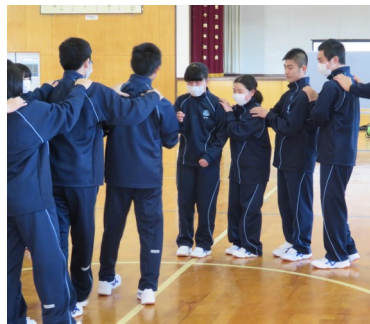
グループエンカウンター