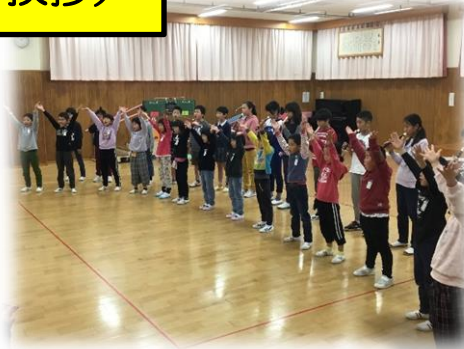
浅子小学校の児童の出し物