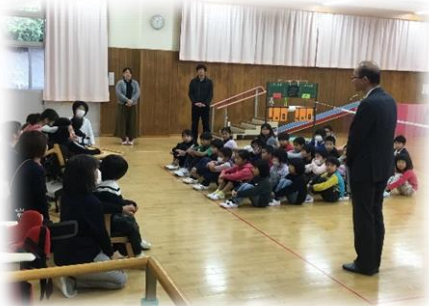
浅子小学校の校長先生の挨拶